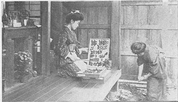
(人夫氏方恒宅三士學理) 日一の婦主き若

(1)女中を相手に、お掃除を済ませ、(2)三十分ほど讀書をする。(3)香屋が参りました、何か思ひつきなものはないかと、台所に出て見る。(4)今日は珍しい五月晴、こんな日に之を張物をと、隣がけ甲斐々々しく庭に出る。(午前)