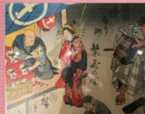
แผนภาพเมืองโจะรุริ

ในปีเดียวกันได้ปรากฏภาพแมวกวักในแผนภาพเมืองโจะรุริ เป็นภาพหญิงสาวโตเก็นชื่อตุ๊กตาแมวกวักอยู่บริเวณย่านอิมะโคะยะคิ ในอาซากุสะ