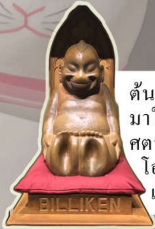
บิลลิเกน

ต้นกำเนิดที่อเมริกา เข้า มาในประเทศญี่ปุ่นช่วง ศตวรรษที่ 20 แพร่หลายที่ โอซาก้า เชื่อว่าลูบที่เท้า แล้วจะสมปรารถนา