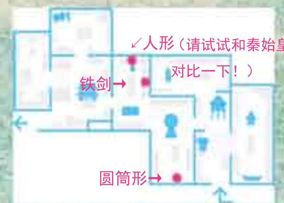
人形 (请试试和秦始皇兵马俑对比一下！) 铁剑

埴轮，即 形状的一种陪葬品。有圆筒形和人形埴轮。两种都是作为驱逐邪恶，守卫神圣空间的象征，被广泛地用于贵族墓葬。