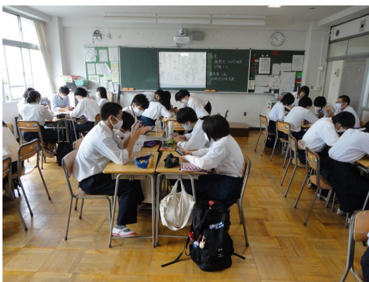
グループ活動の様子