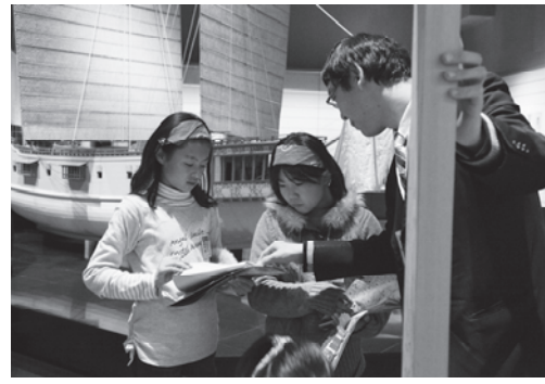
織田信長制札を見学 2