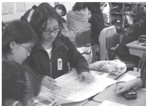
初めての古文書との出会い