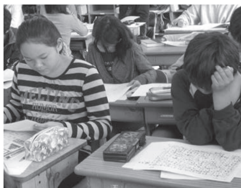
古文書の読解に取り組む

・次に、「豊臣秀吉刀狩条書」（前出の早稲田大学図書館特別資料室所蔵、画像データベース使用）を読ませた。