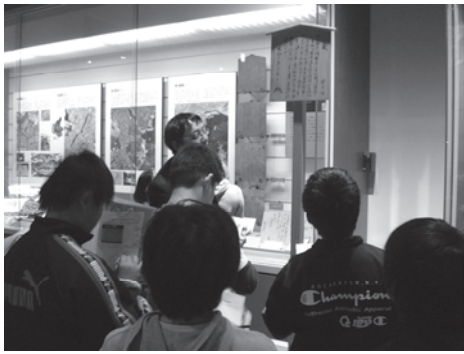
織田信長制札を見学 1