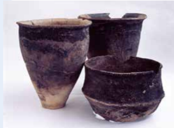
年代を測定した福岡市雀居遺跡出土の弥生土器