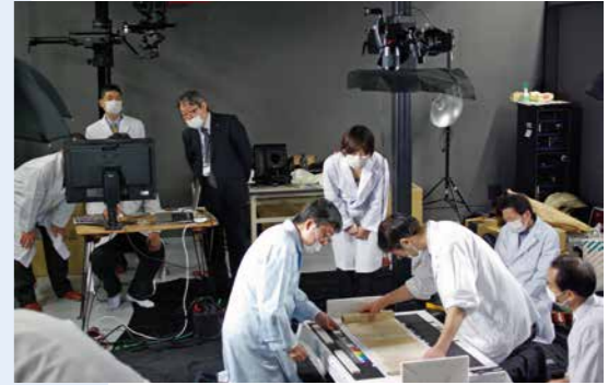
正倉院文書の複製製作

8世紀の貴重な史料を後世に伝えるため、正倉院宝物の一部である正倉院文書の複製事業を行っているほか、庫外に伝存する文書の収集にも力を入れています。