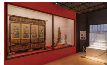
シーボルト没後150年の里帰り「よみがえれ!シーボルトの日本博物館」