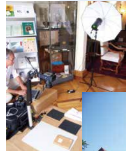
シーボルト子孫宅(ドイツ・シュルヒテルン)での資料調査