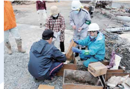
気仙沼市での文化財レスキュー