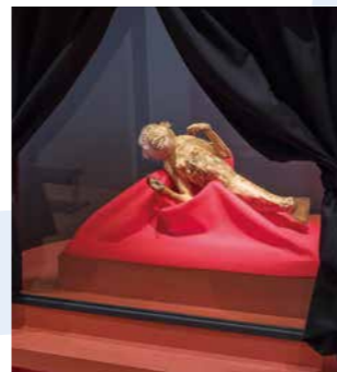
ホンモノ?の人魚のミイラを展示した「大ニセモノ博覧会」