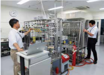
分析のための炭素を取り出す真空装置(歴博の総合研究棟・年代実験室)